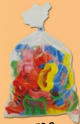
Nr. 12450 6