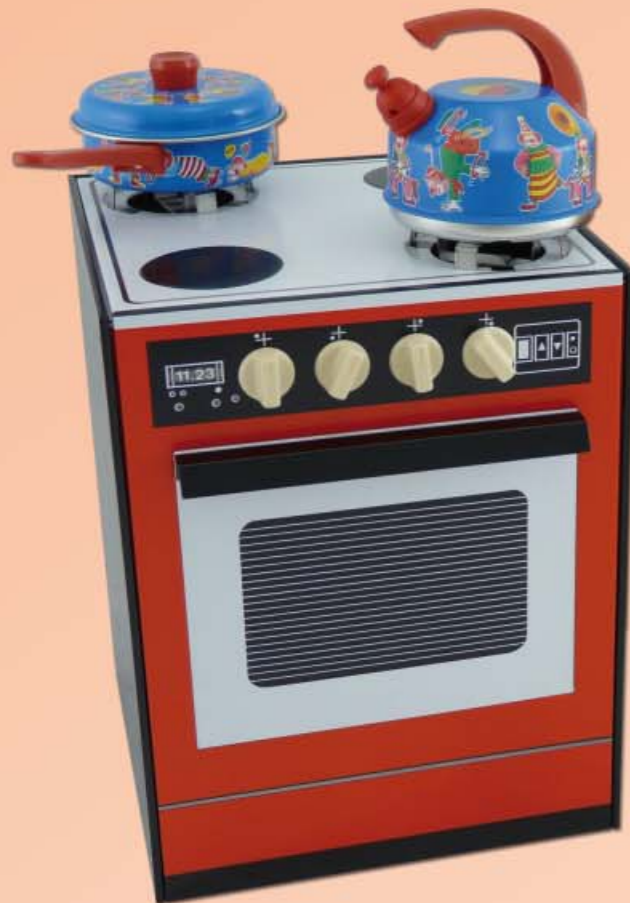
14500 6 (ohne abgebildetes Zubehör)