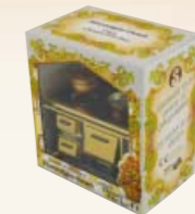
Verpackungsbeispiel Sample of packing Emballage l'exemple

Packung/packing/emballage: 1 Stck./piece/pièce Karton/box/boîte – dimension: 24,5 x 27 x 16,5 cms Gewicht/weight/poids: 0,672 kgs. 6 Stck. im Versandkarton 6 pieces into a master carton 6 pièces dans un carton d'expédition 50,5 x 50,5 x 28,5 cms – 4,732 kgs.