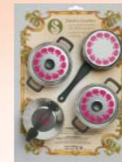
Verpackungsbeispiel Sample of packing Emballage l'exemple

14500 6 – Modellherd, gross Packung/packing/emballage: 6 Stck./pieces/pièces Gewicht /weight/poids: 5,496 kgs. Versandkarton/master carton/carton d'expédition: 63 x 27 x 42 cms